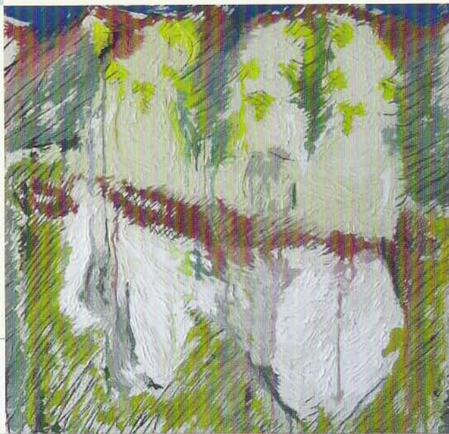
Marco Arman Trinità: immagine, traccia olio su tela cm 70 x 70